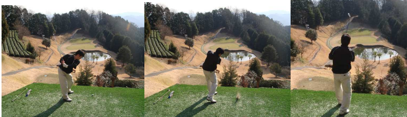
息子のアイアンショット…!! さすが、ゴルフ場勤務(関係ないかあ～)…スイングは良いがあ～ その結果は、左グリーンラフ…2オン、1パット「ナイスパー」 ヤツたねえ～ 右をクリックすると「スイング動画を見る事ができます」見てやって下さい。 http://www.5e.biglobe.ne.jp/~konchan/090107hiro.MPG