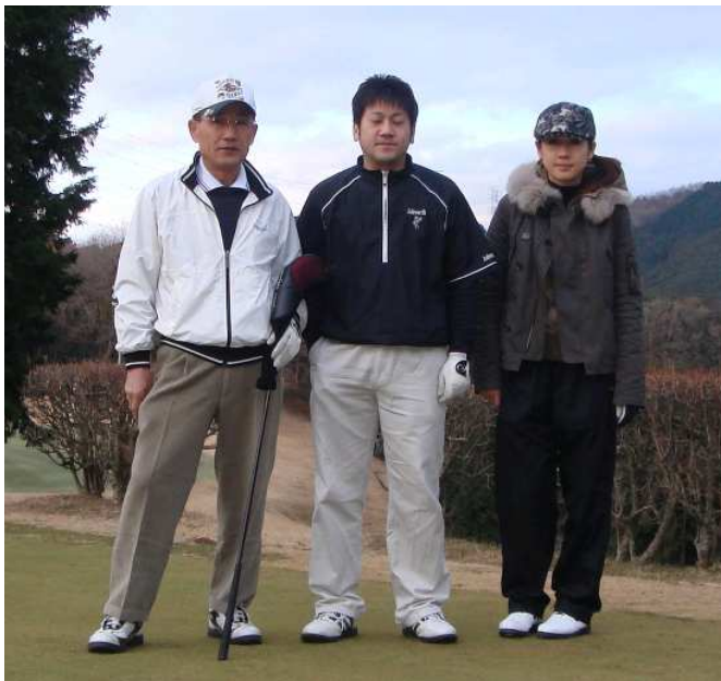
ここでも…恒例の三脚を使用…スタート前の記念写真…オヤジと子の差が明確だね…!!