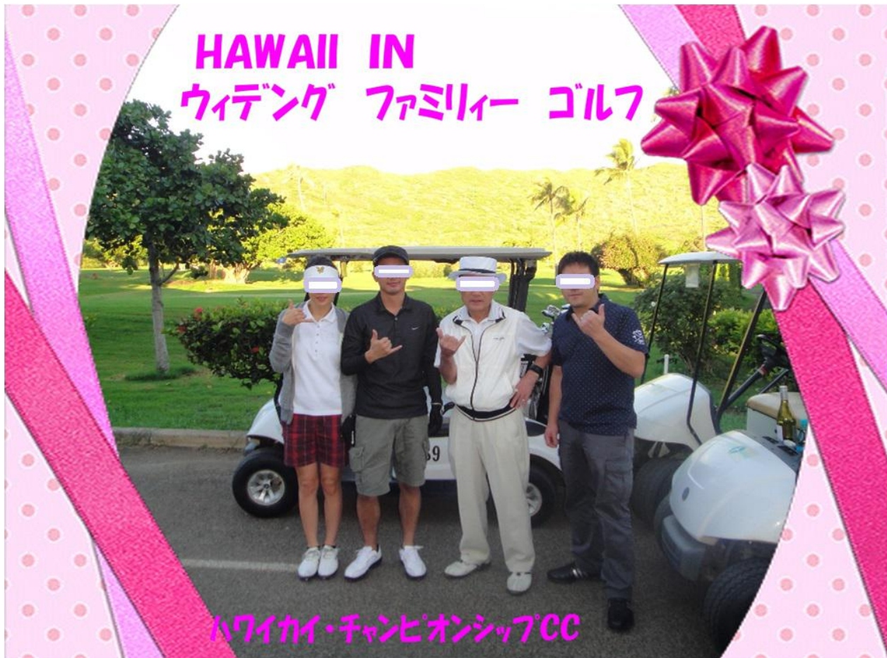
恒例…スタート前の三脚使用セルフタイマーによるスナップ写真で～す。ハイ…アロハ～!! 本日はハワイでの最終日勿論「HAWAII KAI CHAMPIONSHIP GOLF COURSE」はじめて、天気は晴れ…最高のゴルフ日和…娘新婚夫婦と私達親子のファミリーゴルフ…!! 娘に感謝…一生のメモリーゴルフでした。

やはり、全員「レンタル道具」なので、イマイチ思うようにならず、使いづらい…それがスコア低迷の要因か…!? また、グリーン周りのアゴバンカー多い…入ってしまったら大タタキ…間違いなしスコア低迷ながら和気藹々と初ハワイで楽しくラウンド出来、思い出となった。