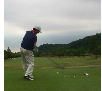
紺野さん ただ一人池ポチャで最悪…!!