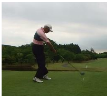
福田さん 本来はもっと良い筈…