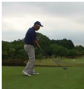
森山さん 安定した内容で優勝