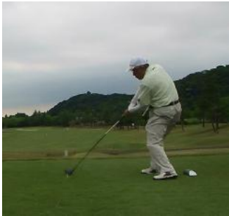
広瀬さん 普段ショットより好調